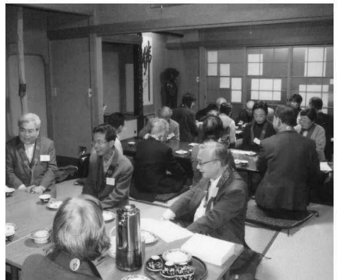
連研 班ごとの話し合い