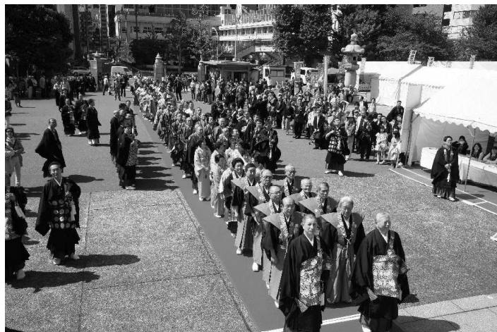
「築地本願寺親鸞聖人750回大遠忌法要」厳修 4月27日(土)~30日(火)