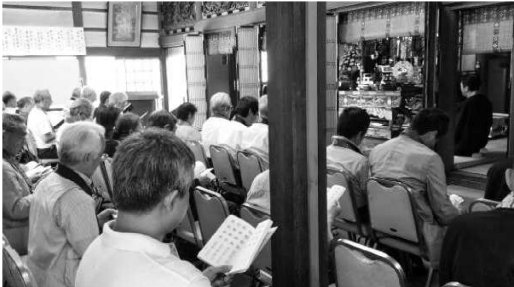
連研第五回（本年六月） 明西寺にて開講の「おつとめ」