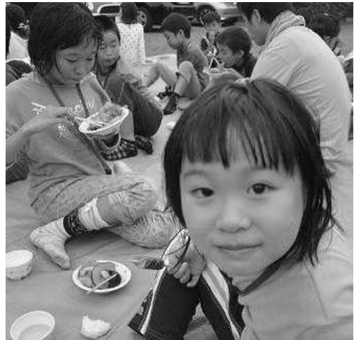
おいしい顔ってこんな顔！

上手に作ったつもりでも、飛ばし方で飛距離は左右され、年齢に関係なく楽しめたようです。