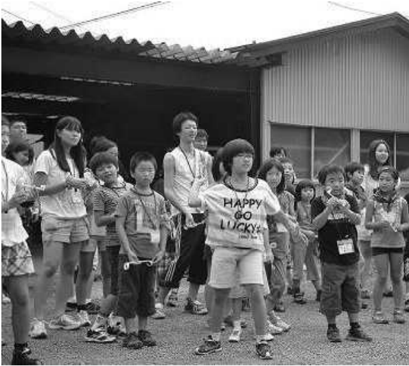
飛べ！ストローグライダー

境内で写真撮影後、バスで忍野八海へ移動し、宿にて昼食の後は、ストローグライダーを作り、飛距離の競争です。