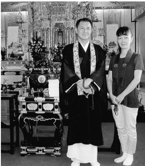
藤原住職と坊守様